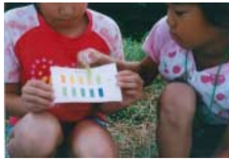
この水路の水質はどうか？