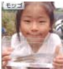
調査で採れた魚を持つ子供達