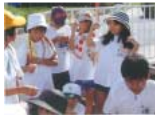
みんなで水質の調査