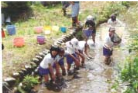
水路に入って魚の調査