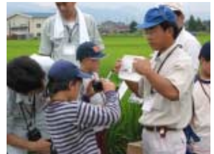
ただいま、写真撮影中！