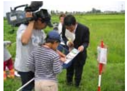
「この魚はねえ・・・」TVの取材中

今年度は、各調査主体が参加者の募集を行い、全国68ヶ所で、行政と地域の方々との共同調査を実施しました。調査の状況は、地方新聞やTV等で多数取り上げられています。