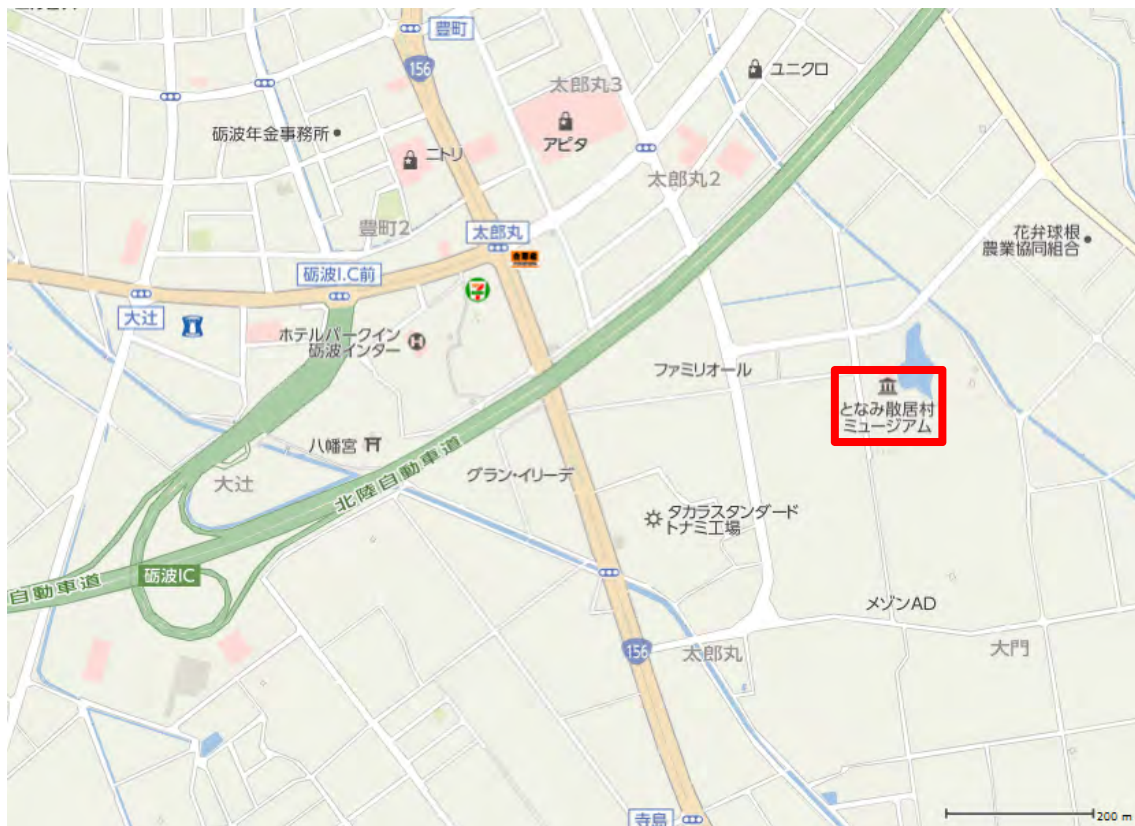
となみ散居村ミュージアム位置図