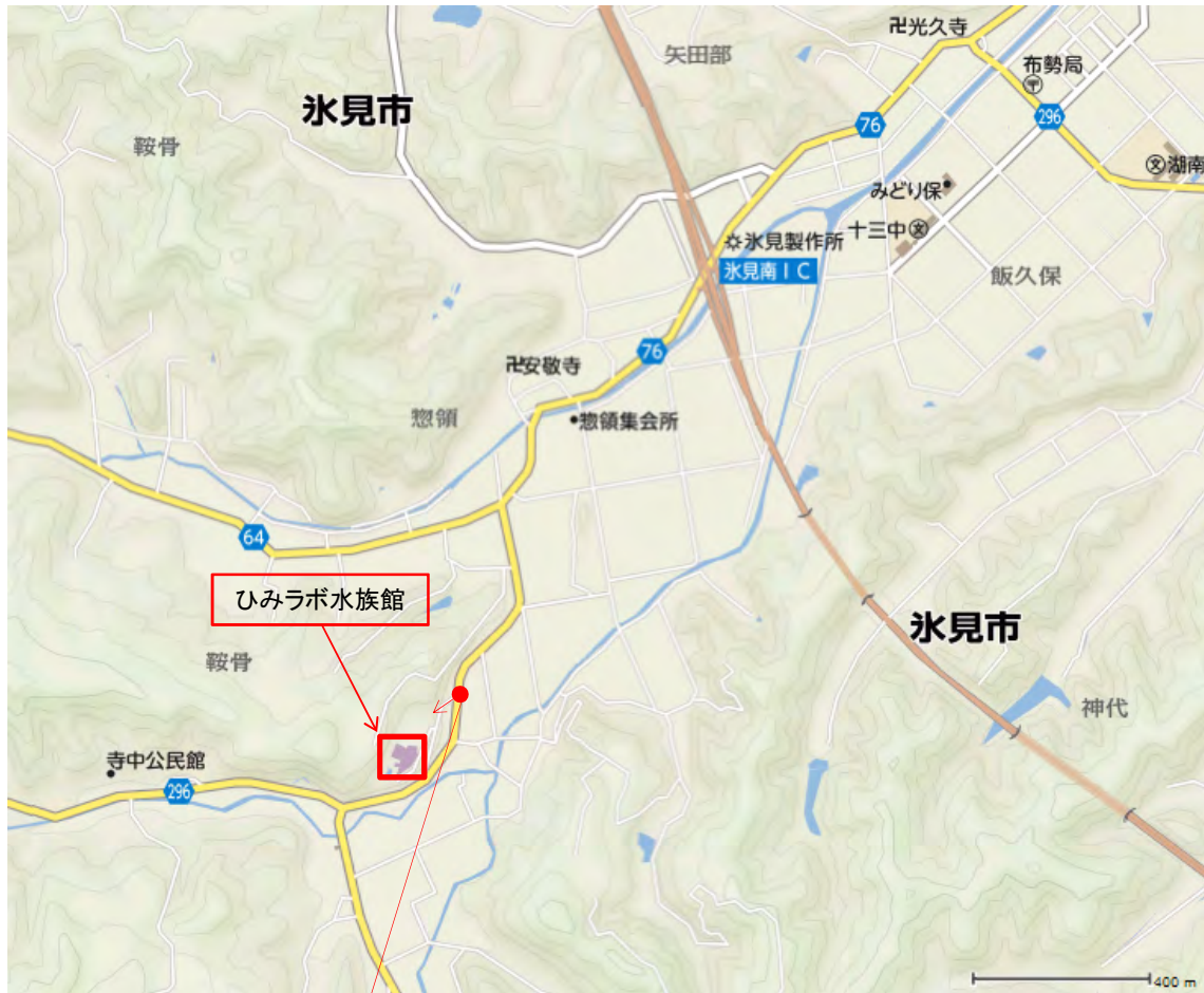
ひみラボ水族館位置図