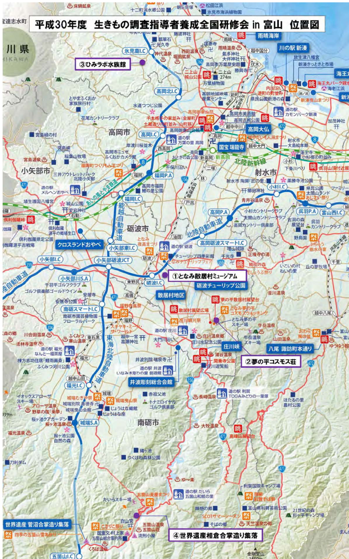
○研修会場・宿泊施設位置図