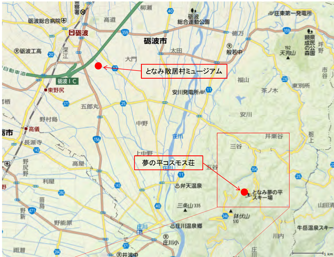
夢の平コスモス荘位置図