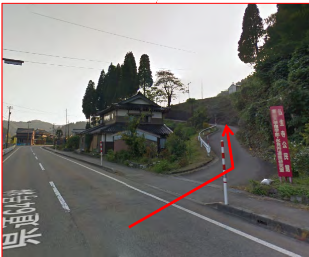
ひみラボ水族館への入口